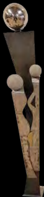
Alain Perrin - Exposition "Familles" Archives Municipales, Cloître des Récollets, rue des Récollets Septembre à décembre