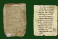
Manuscrit de la Bible, tiré d'un manuscrit de la Bible, montrant des pages de texte en hébreu.