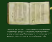
Manuscrit de la Bible, tiré d'un manuscrit de la Bible, montrant des pages de texte en hébreu.