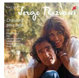
Album Vinyle et CD Serge Rezvani « Chansons pour Lula » 2023 Productions Jacques Canetti