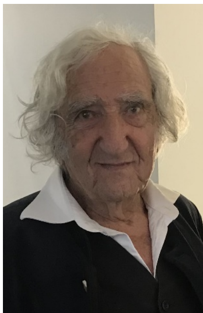
Serge Rezvani - Photo libre de droit