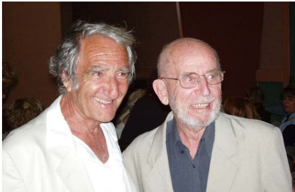
Serge Rezvani et Jacques Baratier, réalisateur du film Dragées au Poivre (1963)

Serge Rezvani est l'invité exceptionnel de Ciné Art , festival de cinéma et chanson qui se déroule tous les ans à Metz. Pour cette nouvelle édition, Serge Rezvani a accepté par amitié de venir présenter des films pour lesquels il a composé des chansons qui ont fait, depuis, le tour du monde : « Le tourbillon de la vie » dans « Jules et Jim » de François Truffaut, « Jamais je ne t'ai dit que je t'aimerais toujours » dans « Pierrot le fou » de Jean-Luc Godard,